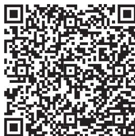
Přihláška na DST 2023